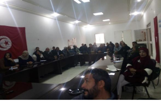
2.2.8- صور الجلسة العامة :